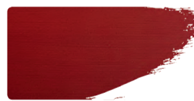
975+923 / 1:1