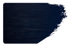
973+949 / 1:1