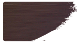
973+923 / 1:1