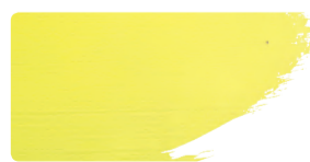
982+912 / 1:1