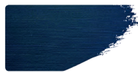
975+949 / 1:1