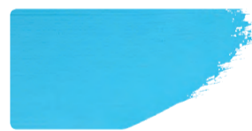
982+949 / 10:1