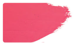
982+923 / 1:1