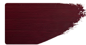
975+923 / 10:1