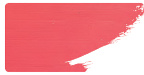
983+923 / 1:1