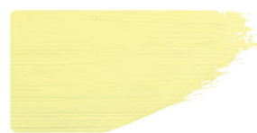
982+912 / 10:1