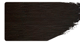
973+912 / 10:1

Bei Weissaufhellungen zeigt sich die Qualität einer Farbe. Hochwertige Farben wirken auch nach dem Beimischen von Weiss rein und behalten ihre Farbkraft. Das Studio Original Mischweiss ergibt besonders helle, brillante Farbtöne. Für verhalteneren, pastellige Töne wird das Ausmischen mit Titanweiss bevorzugt.