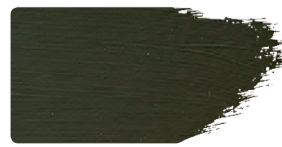
973+912 / 1:1