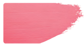
982+923 / 10:1