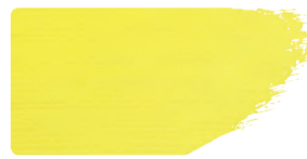
983+912 / 1:1