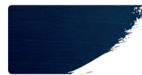
975+949 / 10:1