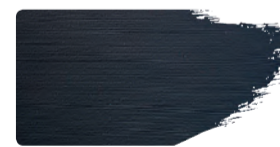
973+949 / 10:1