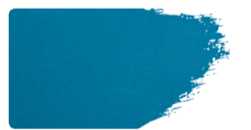
983+945 / 1:1