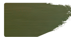
975+912 / 10:1