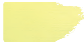
983+912 / 10:1