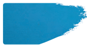
982+949 / 1:1