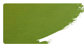
975+912 / 1:1