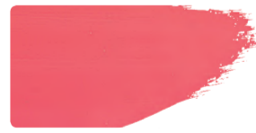
983+923 / 10:1