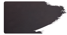
973+923 / 10:1