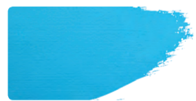
983+949 / 10:1