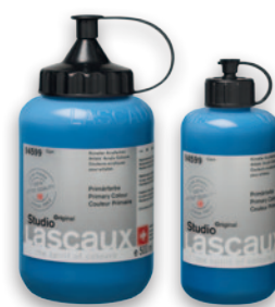
Art. No. 94599 500ml, 250ml