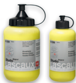
Art. No. 91299 500ml, 250ml