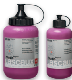
Art. No. 93199 500ml, 250ml